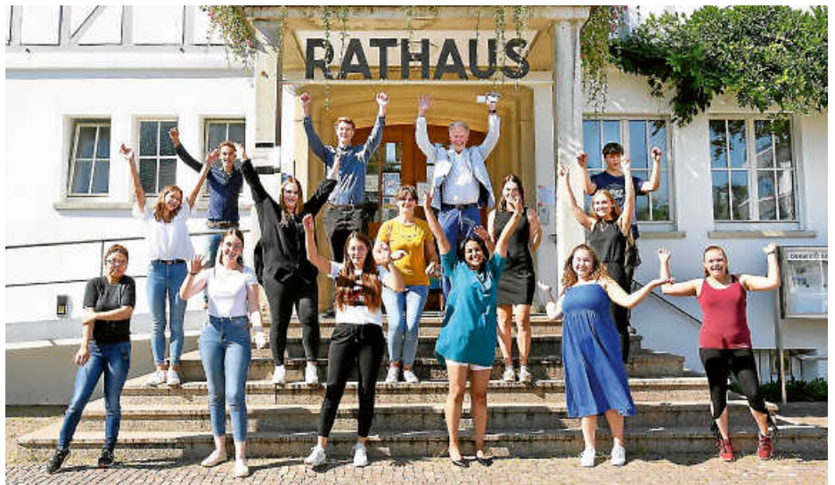
Die neuen Azubis freuen sich auf spannende Aufgaben bei der Stadt.