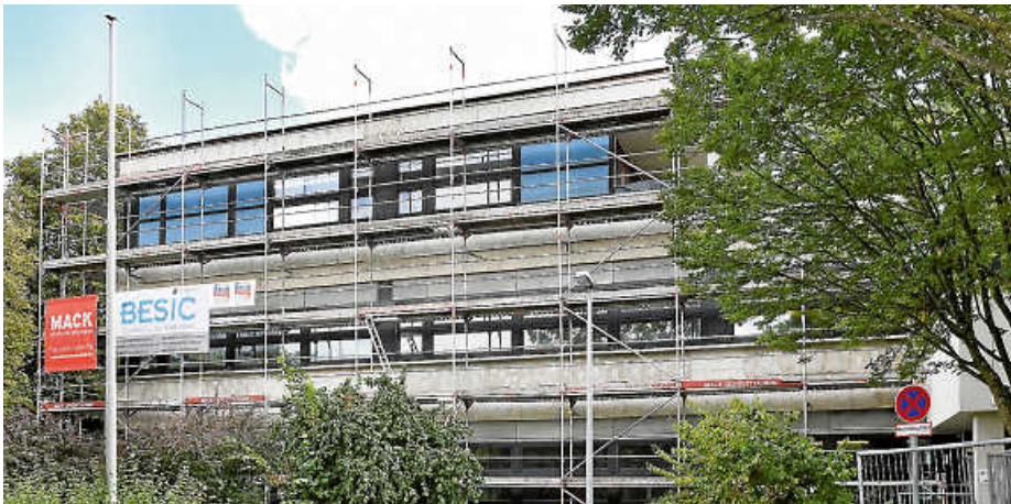
Handwerker haben damit begonnen, die Schönbuchschule zu sanieren.

Die Sanierung der in die Jahre gekommenen Schönbuchschule in Leinfelden ist in vollem Gang. In dem 1971 errichteten Gebäude ist nach rund 50 Jahren mehr als Kosmetik notwendig. So entspricht das Gebäude nicht mehr den energetischen Standards, weshalb die Fassade nun in einem ersten Schritt gedämmt wird. Auch die Fenster werden modernisiert und mit einer Dreifachverglasung versehen. Um den Energiebedarf zu reduzieren, werden außerdem die alten Nachtspeichergeräte abgebaut und durch eine neue Zentralheizung ersetzt. Zusätzlich bekommen die Unterrichtsräume dezentrale Lüftungsgeräte, die die Beheizung und Belüftung übernehmen. Und die alten Lampen werden durch neue LED-Leuchten ersetzt, was den Energiebedarf reduziert. Es wird jedoch nicht nur die Gebäudetechnik