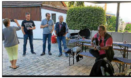
Ständchen im Höfle

Unser traditionelles Open Air am 11. Juli musste zwar wegen der Corona-Pandemie ausfallen. So ganz ohne Feier wollten wir den Tag nach 25 Jahren aber dann doch nicht passieren lassen. Und so traf sich der Vorstand der BGO am Abend des Open Air auf Currywurst und Bier, später auch noch auf den einen oder anderen Caipirinha.