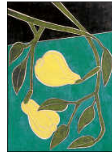
Zweig mit Früchten III, 2019, Öl auf Holz, 100 x 70 cm