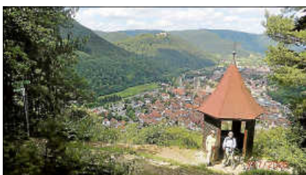
Blick vom Aussichtspunkt Michelskappele auf Urach

Sonntag, 19. Juli - Wanderung auf den Hochbergsteig bei Bad Urach mit Rucksackvesper. Wir beachten dabei die geforderten Auflagen der Corona-Verordnung vom 23.06.2020. Danach dürfen wieder "Radfahrer, Läufer oder Wanderer auf öffentlichen Wegen, Straßen und in Parks in einer Gruppe mit bis zu 20 Personen unterwegs sein". Die für 02. August vorgesehene Wanderung " Märchenhaft von Tübingen zum Märchensee " wird auf Sonntag, 09. August , verlegt.