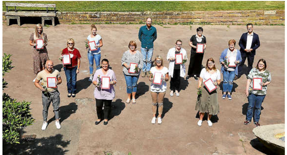
Haben ihre Fortbildung erfolgreich abgeschlossen: Stellvertretende Leitungen von Kinderbetreuungseinrichtungen in der Stadt.