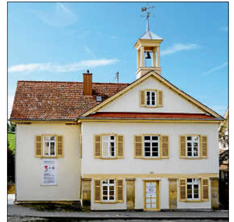
Altes Rathaus Musberg

Der Kulturkreis bietet seinen Besuchern ein breites Spektrum zeitgenössischer Kunst: Malerei, Zeichnungen, Radierungen, Linolschnitte, Lithografien, Skulpturen, Fotografie. Mit seinen sechs Kunstausstellungen pro Jahr leisten die Mitglieder des Kulturkreises in ehrenamtlicher Arbeit einen Beitrag zum kulturellen Leben der Stadt. Werden Sie Mitglied in Kulturkreis LE e.V.!