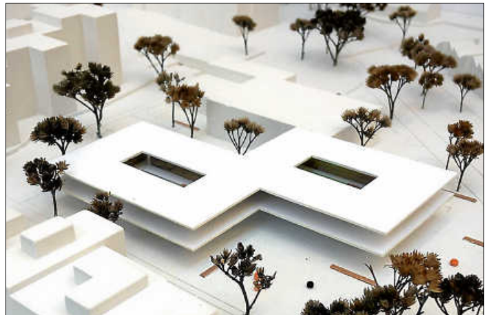
So wie in diesem Modell soll die erweiterte Schule aussehen.

Der Umbau der Goldwiesenschule wird außerdem dafür genutzt, die Räume im Unter-