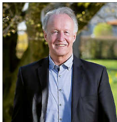
OB Klenk: „Halten Sie sich bitte weiterhin an die Regeln.“

Auch Sport im Freien ist unter bestimmten Rahmenbedingungen, hauptsächlich was die Abstandsregeln betrifft, wieder erlaubt. Und ab Montag dürfen dann die Gastronomiebetriebe öffnen, im Außenwie im Innenbereich. Wir werden großzügig sein, wenn es um die Erlaubnis für Außensitzplätze geht. Gerade im Freien