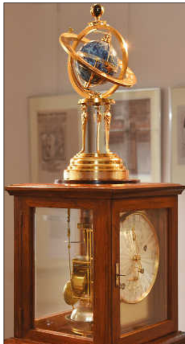
Eine Replik der „kleinen braunen Himmelsmaschine“ von Hahn – das Original der astronomischen Uhr steht im Landesmuseum Stuttgart – ist im Stadtmuseum in Echterdingen zu sehen und ein Nachbau des Uhrmachers Alfred Leiter.