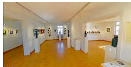
Galerie Altes Rathaus Musberg

Wegen der Corona-Pandemie muss die Galerie Altes Rathaus bis auf Weiteres geschlossen bleiben. Der Kulturkreis LE e.V. gibt den Kunstinteressierten aber trotzdem die Möglichkeit, die derzeitige Ausstellung mit Malerei, Druckgraphiken und Skulpturen von CHC Geiselhart zu sehen. In Zusammenarbeit mit business media dynamics GmbH wurde auf der Homepage der Galerie ein virtueller 360 Grad - 3D - Panorama - Rundgang eingerichtet, mit dem die Ausstellung interaktiv besucht werden kann. Auch bei geschlossener Galerie können so die Kunstwerke in Ruhe betrachtet werden. Der virtuelle Ausstellungsbesucher kann von Raum zu Raum gehen, sich einzelne Exponate heranzoomen und Texte zu den Kunstwerken lesen. Link: www.altes-rathaus-musberg.de