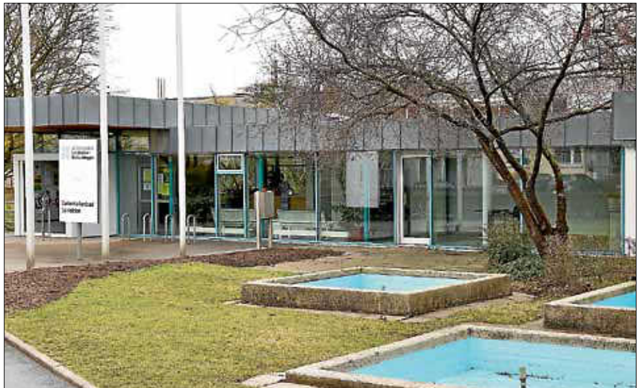
Die Technik des Gartenhallenbads ist nicht mehr auf der Höhe der Zeit.