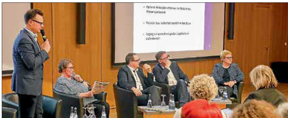
Bei der gut besuchten Dialogveranstaltung wurden mehrere Möglichkeiten diskutiert, wie das künftige Hallenbad aussehen könnte.