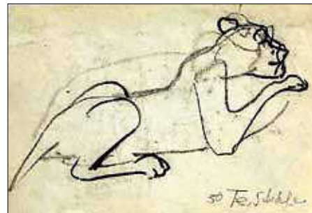
Löwe, 1950, 20,5 x 14,5 cm, Kohle auf Papier