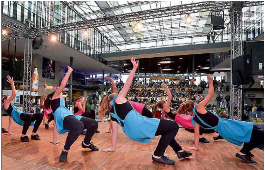
Auch die Tänzerinnen des Theaters unter den Kuppeln treten auf der Atriumbühne auf.

Interessant wird es bei den Darbietungen der Echterdinger Tracht, die von der Krautkultur erzählen und traditionelle Tänze aufführen werden, aber auch bei den prämierten Bartträgern von „Belle Moustache“, die auf der Bühne einen Bart stylen und aus dem Bartnästkästchen plaudern werden. Die TänzerInnen des Theaters unter den Kuppeln präsentieren Auszüge aus dem Jubiläumsprogramm, und die Formationen des Jugendkulturzentrums Areal treten mit Weltmeister Poppin Hood auf die Bühne. Kulinarischer Glanzpunkt wird die kleine Kochshow der LE Miniköche mit Projektleiterin Beate Graf sein. Närrisch hingegen