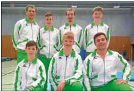
Erfolgreich gegen MTV Stuttgart II

Vorschau: Kommenden Samstag kommt mit dem TB Neckarhausen ein starker Gegner zu uns, ein spannender Wettkampf mit offenem Ausgang werden. Wettkampfbeginn ist 16 Uhr in der Sporthalle Stetten – wir freuen uns über zahlreiche Zuschauer, die uns unterstützen (die Halle ist bewirtet).