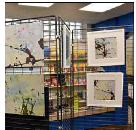
... oder Fotografien von Heidemarie Fruth bei Buchhandlung Bürobedarf Ebert.

> Finissage mit langem Einkaufsabend in Leinfelden bis 22 Uhr ist am Freitag, 29. März, 18 Uhr, in der Stadtbücherei Leinfelden, Neuer Markt 1.