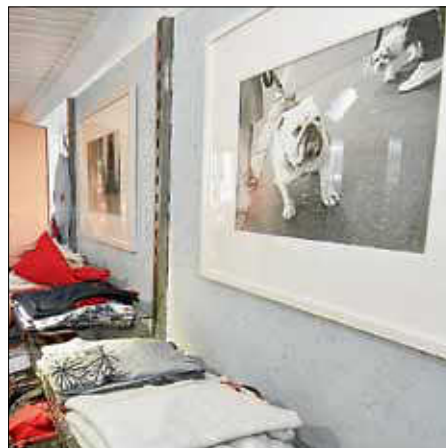
... Hundeporraits von Hagen Kälberer bei Positiv-Boutique ...