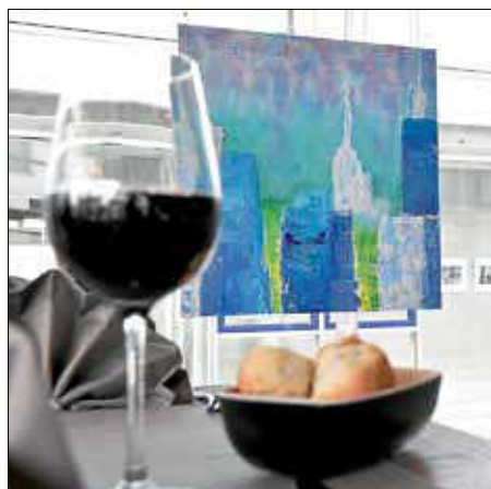
... Acryl auf Leinwand von Andrea Supper bei DaVino, ...

in Leinfelden und Echterdingen ein bunter Strauß an Grafik, Malerei oder Fotokunst – Werke, die die Händler selbst ausgewählt haben. Ein besonderes Highlight ist dieses Jahr die Teilnahme des Deutschen Spielkartenmuseums: Die Karten-Raritäten wurden