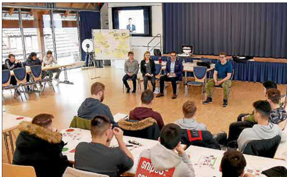
Zeigten sich bei dem politischen Tag mit vielen Ideen von ihrer kreativen Seite: Schülerinnen und Schüler der Ludwig-Uhland-Schule und Lindachschule.

Ein weiteres großes Anliegen für die Schüler ist freies WLAN. Eine Schülerin meinte, es gebe Eltern, die nicht viel Geld haben, da sei ein Handy mit Vertrag nicht selbstver-