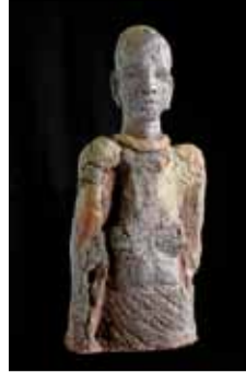
Margot Spuhler: Afrika, Tonskulptur, 55 cm hoch

Vernissage ist am Samstag, 15. September 2018, um 17 Uhr.