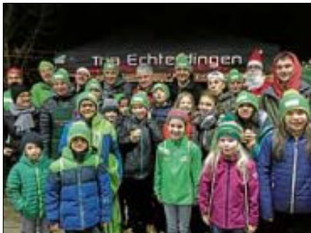
Vielen Dank an Joachim Mewes und Olli Kukuk für die Gesamtorganisation!

Der Weihnachtsmann fühlte sich sichtlich wohl und das, obwohl die Tria-Kids ihm mit ihren neuen coolen Tria-Mützen viel Konkurrenz machten.