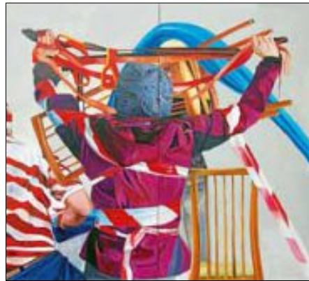
Bettina Pradella: entgegnetreten 2017, 120x130 cm, Öl auf Leinwand

Die Ausstellung ist bis zum 18. Februar 2018 zu sehen.