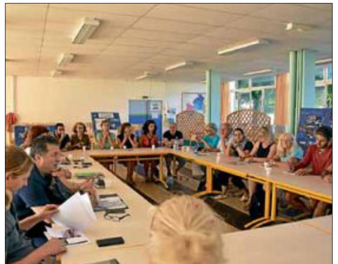
Das Partnerschaftsgremium (links) legte das Austauschprogramm des kommenden Jahres fest. Gemeinsam mit Lehrerinnen und Lehrern aus Manosque wurde der Schüleraustausch thematisiert.