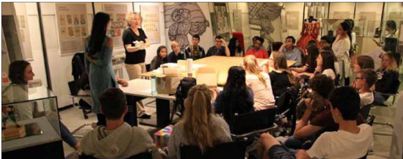
Im Schaudepot des Spielkartenmuseums entdeckten die indischen Schüler historische Kartenspiele aus ihrer Heimat.