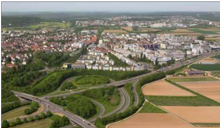
Die Nähe zu Autobahn, Messe und Flughafen macht LE zum gefragten Standort.

In den Fokus rückt deshalb zunehmend die Revitalisierung von Flächen oder Objekten. Beispiele sind das ehemalige Brixner-Areal in Echterdingen, auf dem die Bülow AG