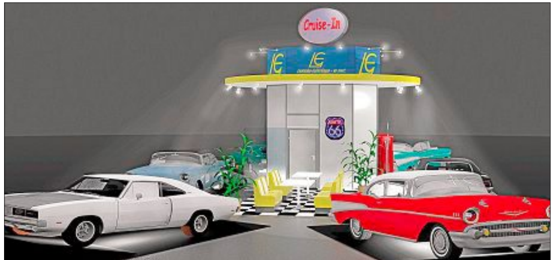
Das Stadtmarketing bewirbt u.a. das US-Car Meeting auf der Retro Classics.