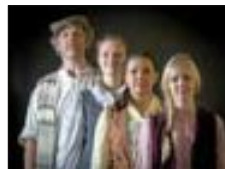
Tevje und seine Töchter

Klar freuen wir uns auf Weihnachten, aber im Verborgenen wird bereits emsig für den nächsten Freilicht-Sommer gearbeitet. Für Anatevka gibt es neben