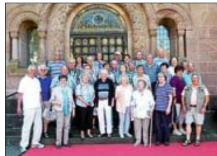
Reisegruppe OGV Stetten

Die Reisegruppe des OGV Stetten bestehend aus 32 Mitgliedern war auf einer 4-tägigen Reise durch die Vulkaneifel. Aus Meerfeld ging es zu verschiedenen interessanten Orten wie z.B. Gerolstein, Mühlen in Birgel, zu den Maaren und Lavabombe in Strohn. Die Rückfahrt erfolgte über die Burg Eltz. Für alle Beteiligten war es ein gelungener Ausflug.