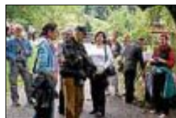
Zwischenstopp vor der Brennstube

In Wolfach angekommen, besuchten wir die Dorotheenhütte und konnten bei einer Führung Interessantes über die Kunst der Glasbläserei erfahren. Nach dem Mittagessen ging es weiter nach Gutach auf den Vogtsbauernhof. Auch hier nahmen wir an einer Führung teil und erfuhren wie die Schwarzwaldbauern vor ca. 400 Jahren gewohnt, gelebt und gearbeitet haben. Da das Wetter es gut mit uns meinte, konnten wir anschließend noch bei Kaffee, Kuchen oder auch einem kühlen Bier die letzten Sonnenstrahlen genießen. Dann ging es auch schon wieder heimwärts. In unserer Vereinsgaststätte ließen wir diesen schönen Tag in gemütlicher Runde ausklingen.