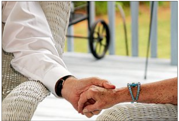
Betreuungsangebote schaffen den Angehörigen Freiraum.

Auf ihre Aufgabe werden die Frauen und Männer in Schulungen und Hospitationen vorbereitet und sie treffen sich zum regelmäßigen Erfahrungsaustausch in der Grup-