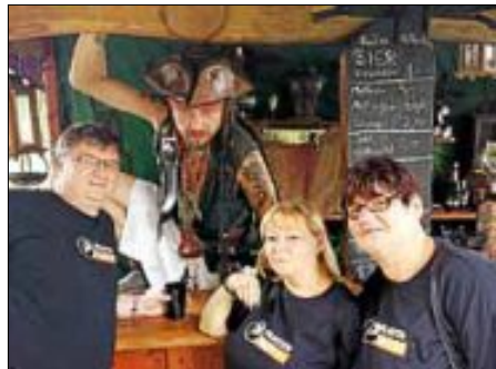
Piraten unter sich

Über diese und andere Themen diskutieren wir bei unserem nächsten Treffen am: 01.08.13 im Paulaner , Echterdingen, neben der Kirche