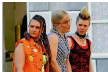
Reisegäste: Punkerinnen, Schüchterne