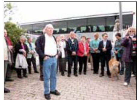
Abschied von der Villa Groff

Verantwortlich: Sabine Pfitzer Tel.: 07119973362