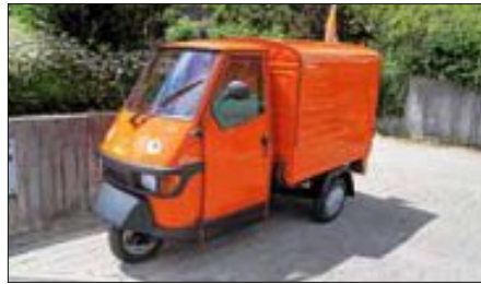
Unsere neu erworbene Piaggio-Ape war der Publikumsmagnet am Stand.

Am Samstag, den 6.7.13, werden einige Piraten bei „LE engagiert sich“ in Leinfelden anwesend sein, um dringende Fragen des Datenschutzes zu beantworten.