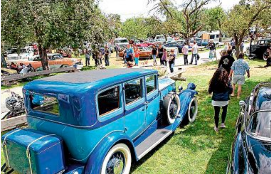
Oldtimer, Cadillac & Co werden zum Besuchermagnet.