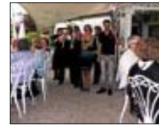
Zu Gast bei Freunden - das Team der Villa Groff.