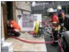
Das Wohngebäude wird aufgrund der Rauchentwicklung belüftet.

Am späten Nachmittag des 22. Mai wurde die Feuerwehr Leinfelden-Echterdingen um 17:49 Uhr zu einem Küchenbrand in einem Restaurant in Echterdingen alarmiert. Nach Eintreffen der ersten Einsatzkräfte stellte sich heraus, dass in der Restaurantküche Töpfe und Pfannen auf dem Gasherd in Brand geraten waren. Die ersten Einsatzkräfte gingen unter Atemschutz ausgerüstet zur Brandbekämpfung mit einem C-Rohr in die Küche im Untergeschoss vor. In der ersten Lageinschätzung waren jedoch keine Personen betroffen, so dass das Gebäude nur vorsorglich geräumt wurde. Als weitere Einsatzmaßnahme wurde frühzeitig eine Belüftung des Gebäudes vorgenommen, um auch den verräuchten Keller und den Brandraum zu rauchfrei zu machen. Der Brandschutz wurde mit einem Löschrohr bis zum Einsatzende sichergestellt. Die Kücheneinrichtung wurde teilweise ins Freie verbracht und der Raum mit einer Wärmebildkamera kontrolliert. Durch die Polizei wurde die Hauptstraße in Echterdingen über die Einsatzdauer komplett gesperrt. Die Feuerwehr LE war mit 8 Fahrzeugen und insgesamt 41 Einsatzkräften vor Ort. Weiterhin waren das DRK und die Polizei im Einsatz.