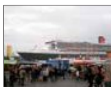
Einlaufen der „Queen Mary 2“ im Hamburger Hafen, vorbei am Fischmarkt

Für viele von uns hieß es am Sonntagmorgen sehr früh aufstehen. Denn natürlich durfte nicht nur ein Bummel über den berühmten St. Pauli Fischmarkt fehlen, sondern auch das Einlaufen eines echten Ozeanriesen, der Passagierkreuzer "Queen Mary 2", wurde in Hamburg an diesem Morgen erwartet. Hierzu bot sich der Fischmarkt zum Spotting idealerweise an. An dieser Stelle möchten wir uns nochmals für die vielen schönen Stunden, die Organisation und die Gastlichkeit unserer Tornescher Feuerwehrfreunde bedanken.