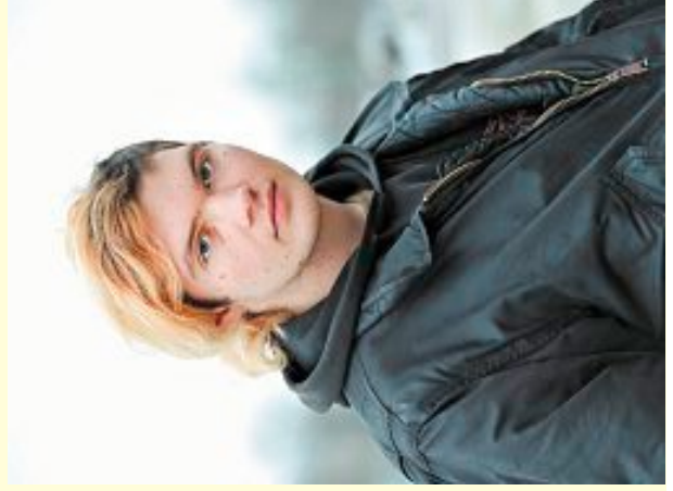
Göran Gnaudschun, Dimitrij

Unter dem Titel »Welt, Reisen, Selbst, Suche« zeigen die Fotografen Göran Gnaudschun, Wolfgang Bellwinkel und Sascha Weidner ihre Werke. Weidner und Bellwinkel erforschen vor allem die eigenen Biografien, was Schauplätze von Osnabrück bis Bangkok umfasst, während Gnaudschun den Blick auf eine Szene von Gestrandeten richtet, die auf dem Ostberliner Alexanderplatz leben.