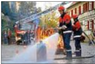
Volles Rohr mit kühlem Köpfigen - die Jugendfeuerwehr LE in Aktion!

FEUERWEHR LE - auch im Web, bei Facebook und Google+