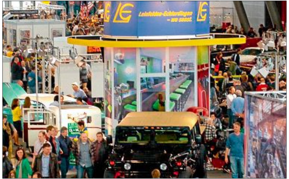
Der LE-Turm wurde zum weithin sichtbaren Anziehungspunkt.