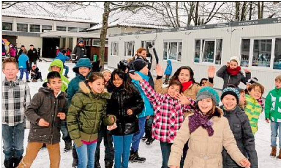
Die Umbaumaßnahmen stören die gute Laune im Pausenhof offensichtlich nicht.

Aktuell besuchen 192 Schülerinnen und Schüler die neun Klassen der Zeppelinerschule. Das Angebot der Ganztagesbetreuung nutzen 113 Mädchen und Jungen.