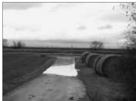
Der Zeppelinsee liegt zwischen gleichnamigem Stein und der L1208.