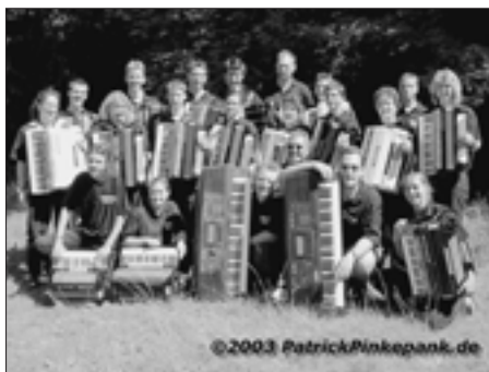
Akkordeonorchester der Musikschule Leinfelden-Echterdingen.

Bankverbindung: Kreissparkasse Esslingen/Neckar, BLZ 611 500 20, Konto-Nr. 10617713